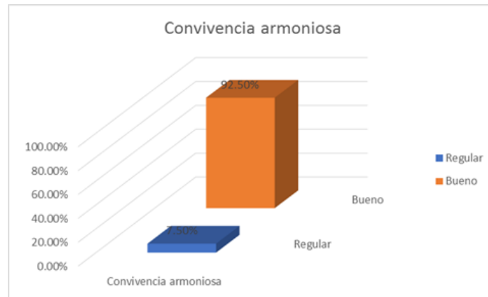
Figura 2. Distribución de la frecuencia y porcentajes de la variable convivencia armoniosa.

Interpretación: De la Tabla 5 y Figura 2, se observa que los estudiantes encuestados manifestaron que el 7.5 % alcanzaron una convivencia armoniosa de regular, mientras que un 92.5 % expresó que tiene una convivencia armoniosa de nivel bueno. Apreciándose de los resultados que la predominancia de la convivencia armoniosa es de nivel bueno.